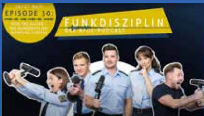
Podcast bei Spotify