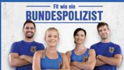
Fitness-Serie auf YouTube