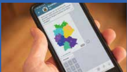
Chatbot bei Telegram